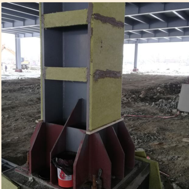
Оклеивание конструкций плитой минераловатной огнезащитной «EURO-ЛИТ» в «короб»