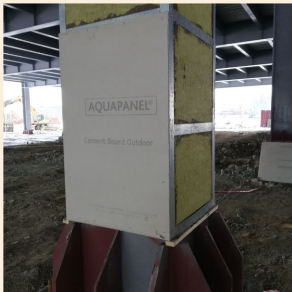
Монтаж каркаса из оцинкованной стали