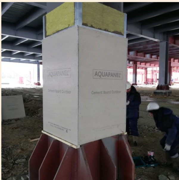
Облицовка пожаробезопасными плитами по каркасу

Для уточнения подробностей, а также запроса цен Вы всегда можете обратиться к Вашему персональному менеджеру или в отдел огнезащитных материалов.