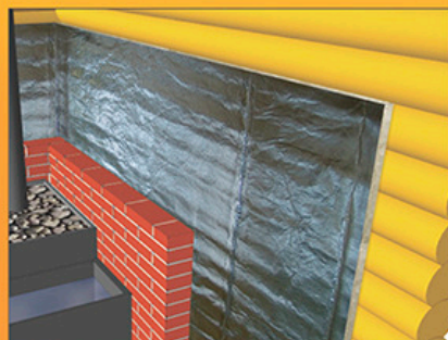
Теплоизоляция и огнезащита печей и каминов